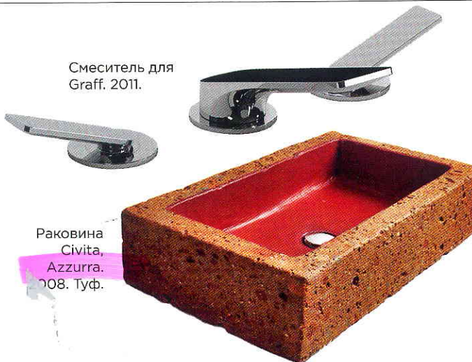
Раковина Civita, Azzurra. 2008. Туф.